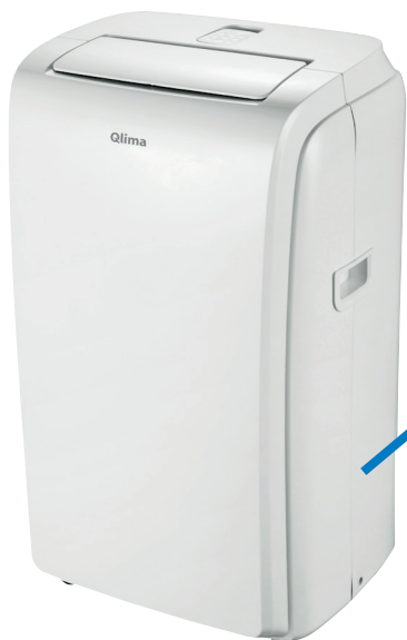
Qlima PH 534